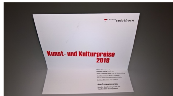
offizielle Einladung zur Übergabe des Anerkennungspreises 2018

Gemeint sind damit unter anderem die Höhenfeuer 🔥 sowie die in der Neuzeit alle drei Jahre stattfindende Sommwendfeier 🌟🌟, welche Ravellen Club Oensingen RCO und Vogelherdclub seit nunmehr 100 Jahren pflegen. Für ihr ehrenamtliches Engagement und ihren unermüdlichen Einsatz zum Erhalt dieser Traditionen ehrte darum der Kanton Solothurn die beiden Vereine im Herbst 2018 und verlieh ihnen den Anerkennungspreis des Kantons Solothurn. 🙌 Die Verleihung fand schliesslich am 19. Oktober 2018 im Parktheater in Grenchen statt, wo sich auch eine kleine Schar von Vereinsmitgliedern einfand. Freudestrahlend und sichtlich stolz nahm unser Vereinspräsident Hans Schnider den Anerkennungspreis entgegen.