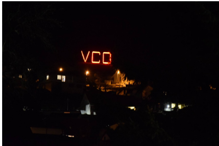
Signet des VCO auf der Vogelherd

Dass schon bald die Sommwendfeier 🎆🎇 ansteht, kündigen unter anderem die beiden Signets an, welche jeweils vom RCO auf der Ravellenfluh und vom VCO auf der Vogelherdherd ein paar Wochen vor deren Durchführung aufgestellt werden. Beide Signets sind schon von Weitem zu sehen, so etwa beim Vorbeifahren auf der A1, wenn man auf die entsprechenden Anhöhen hinaufschaut.