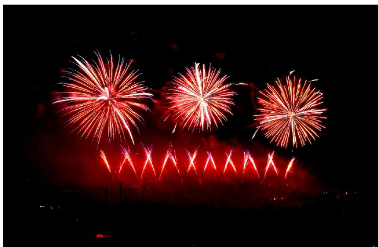
Feuerwerk des VCO (Sommwendfeier 2009)

Dies war ursprünglich so aber nicht geplant, sondern ist schlicht und einfach einem Versäumnis eines Vereinsmitglieds zu verdanken. 🤪🤪🤪 Während langer Jahre war es in unserem Verein nämlich Tradition, dass während des eigenen Feuerwerks das eigene VCO-Signet ausgeschaltet wird. Hierfür wurde eigens ein Vereinsmitglied bestimmt.