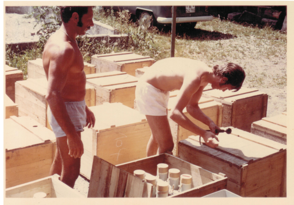
1. August-Feuerwerkseinsatz auf dem Gurten