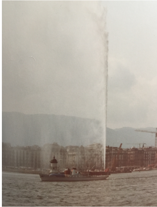
Jet d'Eau in Genf (Privataufnahme aus den 1980er Jahre)

Die zurückgebliebenen Vogelherdler am Genfersee hatten es da weniger gemütlich und warm. Zunächst wurden sie von der Polizei 🚔 gerüffelt, weshalb sie denn noch nicht den Hafen verlassen hätten. Die Stadt Genf wollte spätestens um 22 Uhr den zwischenzeitlich abgestellten Jet d'Eau wieder starten, weshalb sie früher als geplant in See stechen mussten. Vogelherdler wie auch Feuerwerk sollten noch möglichst trocken zu ihrer Abschussposition auf dem Genfer See gelangen. 🌧️